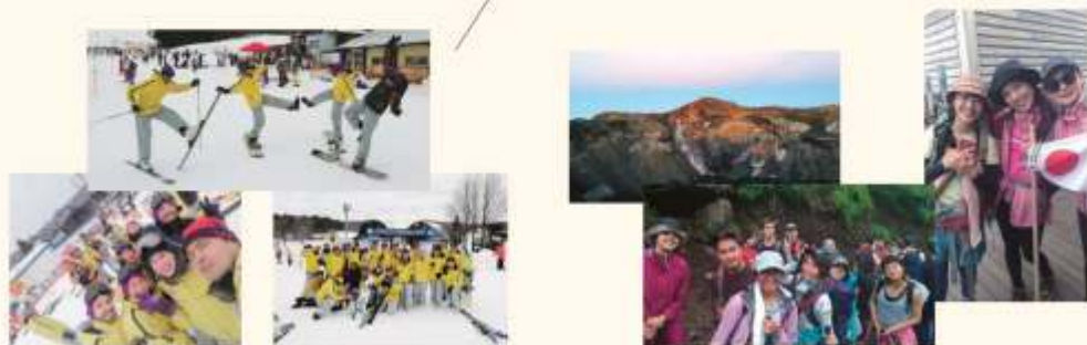
Ski & Snow bord